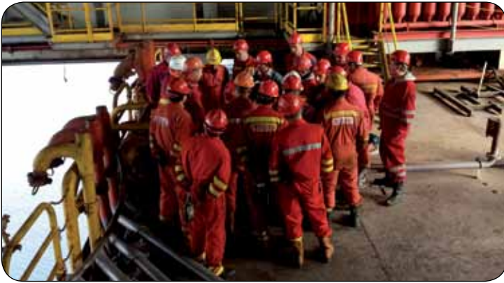
Sindikalna tribina na mjestu rada

Članovi su željni informacija za čije prenošenje nema boljeg načina od osobnog kontakta.