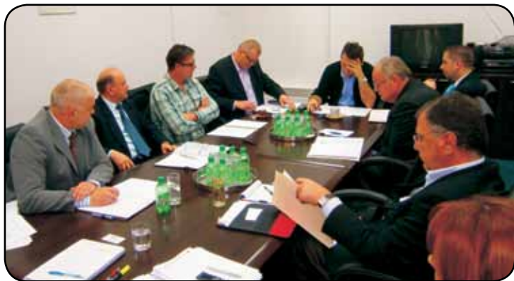
Sa sastanka u Mostaru

Kada kažemo da u pločanskom NTF-u vrijee, nismo rekli ništa novo, međutim novo je to što se od samog početka u normalizaciju stanja vrlo aktivno uključio i naš sindikat.