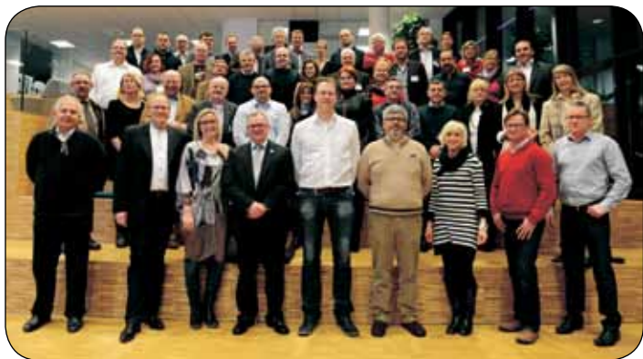
Sudionici seminara u sjedištu Kršćanskog sindikata Danske

Izazovi s kojima se suočavaju sindikati u Europi razlog su organizacije brojnih međunarodnih seminara.