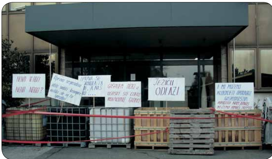
Blokiran ulaz u poslovnu zgradu

DIOKI je još jedan žalostan primjer pogrešnih poslovnih odluka i lošeg poslovanja.