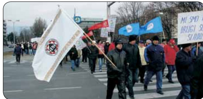
Prosvjednici na zagrebačkim ulicama

šavanje nagomilanih problema, jer se vjerovalo da jedino ona može natjerati većinskog vlasnika na razumne odluke. Vlada se u početku držala rezervirano, ali nakon štrajka glađu i trećeg prosvjeda ozbiljnije se pozabavila DIOKI-jem.