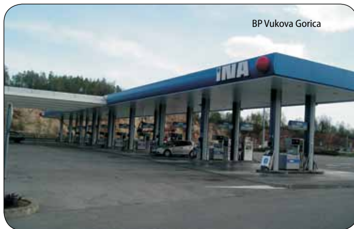
BP Vukova Gorica

Zaista se može postaviti pitanje može li prebacivanje plana za 42% biti razlog za najveću nagradu radnicima ili treba zatražiti odgovornost onoga koji je takav plan postavio? Netko tko postavi plan koji je za 42% manji od prodaje nije ozbiljan rukovoditelj, pa se moramo zapitati koliko su planovi objektivni i tko ih donosi. Koliko je pošteno da, na primjer,