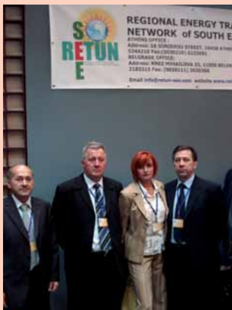
SING-ovo izaslanstvo na Skupštini

Regionalna mreža sindikata energetike jugoistočne Europe (RETUNSEE) održala je u Beogradu, od 18. do 20. rujna 2009., svoju treću redovitu Skupštinu.