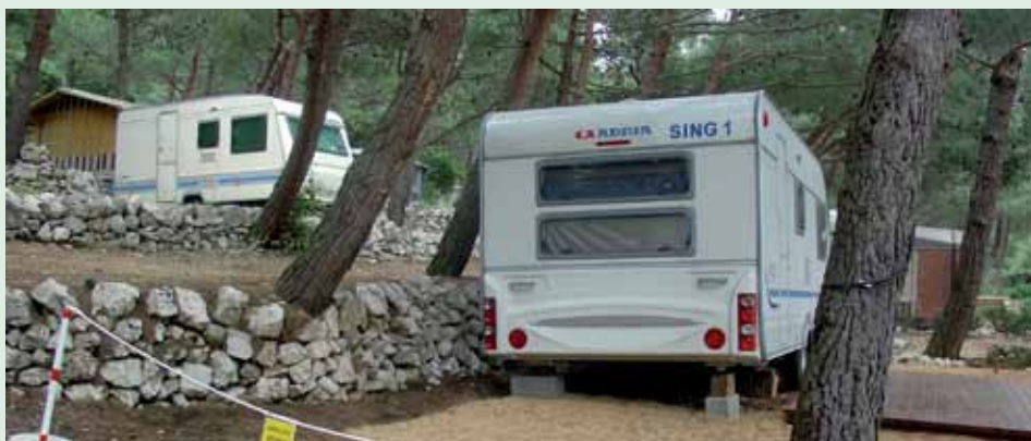
SING-ove kampice na Cresu

Kao i prethodnih godina članovi Sindikata Ine i naftnog gospodarstva dokazali su da su istinski zaljubljenici kampiranja. Ovog ljeta SING-ove kamp kućice smještene u tri auto kampa (Rastovac - Tisno, Slatina - Martinšćica i Boban - Živogošće) koristila su 53 člana Sindikata s članovima svojih obitelji. U svojim kratkim osvrtima u knjigama primopredaje korisnici izražavaju neskriveno zadovoljstvo i želu da se dogodne ponovno vrate. To je najbolja potvrda da je ulaganje u takav oblik ljetovanja za članove pun pogodak.