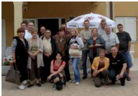
Povjerenici SR I Zagreb

Povoljni uvjeti ljetovanja i ostale pogodnosti za članove i njihove obitelji u SING-ovu odmaralištu u Malinskoj učinili su i ovu turističku sezonu uspješnom.