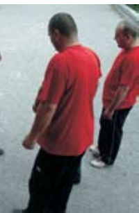
ku su odlučivali milimetri