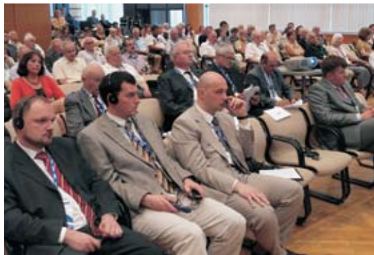
Sudionici Inine Glavne skupštine

Iako je i ova Glavna skupština INE bila dobro režirana, kao i sve prethodne, na kojima se samo moglo „lajati na Mjesec“, ona je ipak formalna prekretnica u budućem poslovanju INE. Promjenom vlasničke strukture MOL je došao u poziciju da preuzme upravljanje INOM, a izbor novoga Nadzornog odbora bio je samo prvi korak prema tome. Nakon Glavne skupštine uslijedilo je imenovanje nove Uprave INE i na taj su način stvoreni svi preduvjeti za korjenite promjene u INI. Nositelj svih aktivnosti bit će MOL, a može se očekivati kako će u budućnosti utjecaj MOL-a rasti, a ostalih suvlasnika padati. Posljedica toga bit će stabiliziranje i poboljšanje poslovanja INE, a za nekoliko će godina INA biti uspješna naftna kompanija s dobrim poslovnim rezultatom. No, put do uspješnosti ni za koga neće biti lagan.