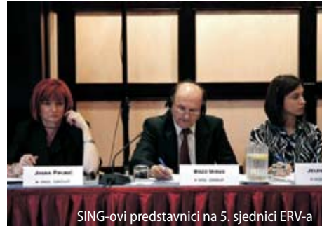
SING-ovi predstavnici na 5. sjednici ERV-a

Europski ured nije odobrio transakciju OMV-a i SURGUTNEFTEGAZ-a, tako da se ruska tvrtka još nije mogla upisati kao vlasnik dionica, već je pokrenula sudski spor.