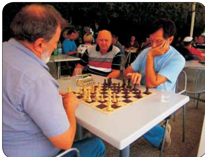
Finale u šahu