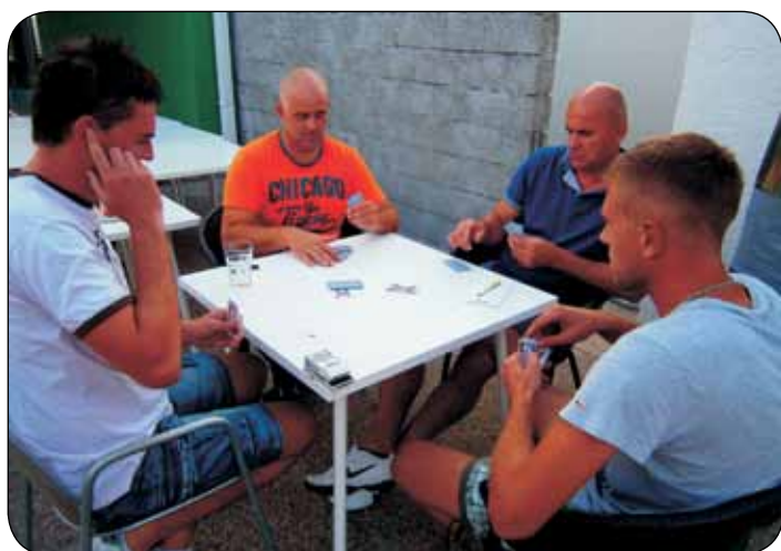
Napeto u briškuli