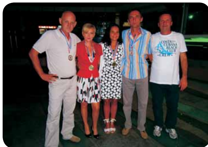
Pobjednici u odbojci na pijesku, mješovito