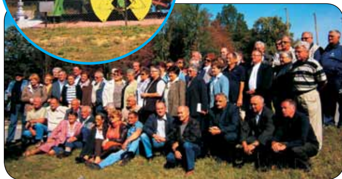
Sudionici okupljanja i spomen obilježje