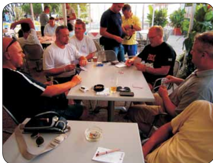
Finale u belotu